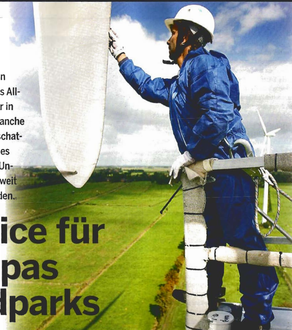
Alle Rotorblätter werden vor Ort begutachtet und gegebenenfalls repariert.