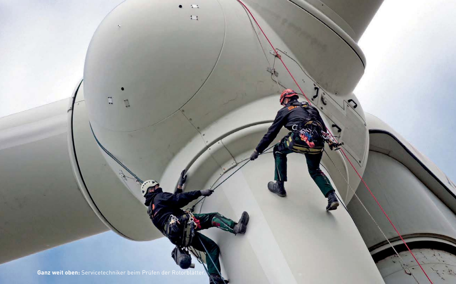
Ganz weit oben: Servicetechniker beim Prüfen der Rotorblätter.